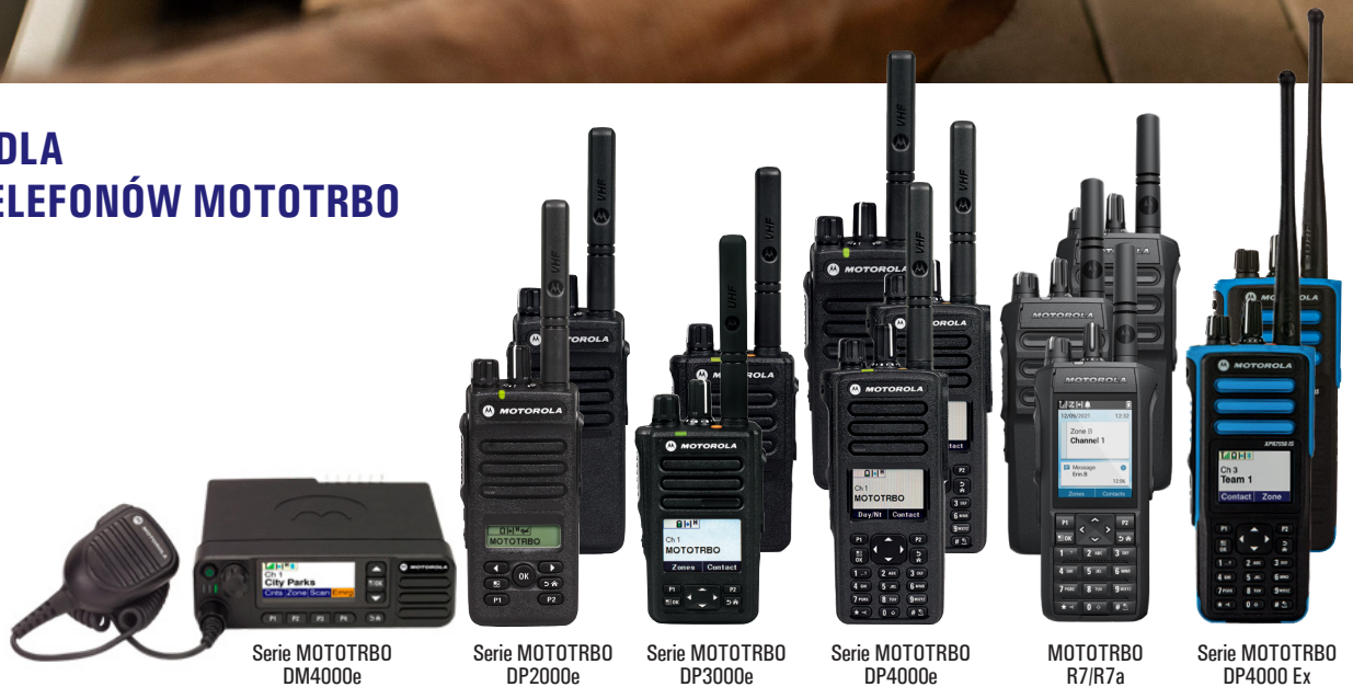
Serie MOTOTRBO DM4000e